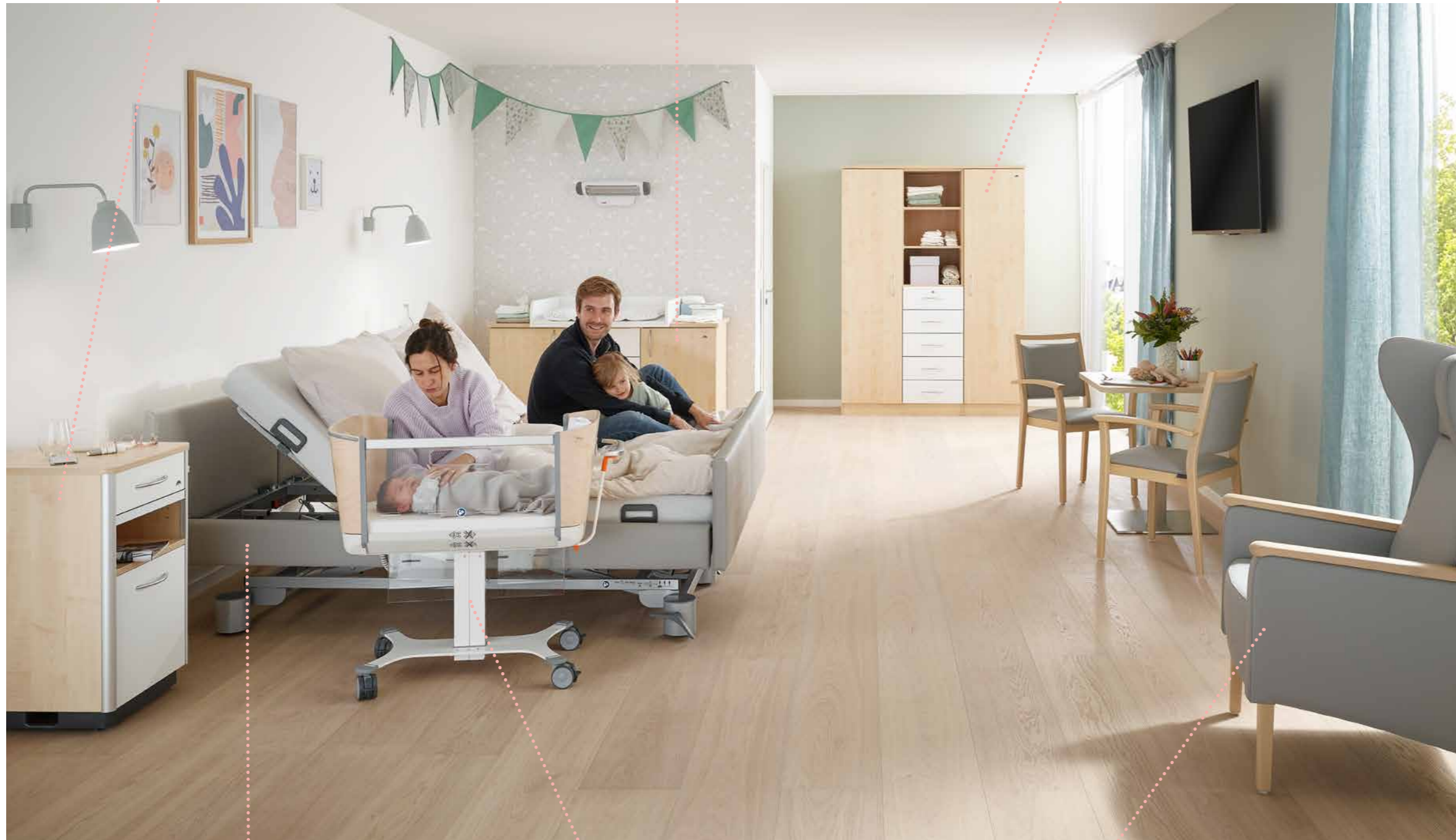
Doppelbett Libra partner