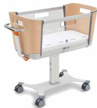
▲ Wohnliches Design: Holzdekor Ahorn

Mit seinen attraktiven Farboptionen und seinem ansprechenden Design ist das Säuglingsbett Jovie auch optisch eine Bereicherung für jede Station. Junge Familien werden sich mit diesem Bett sofort wohl und entspannt fühlen.