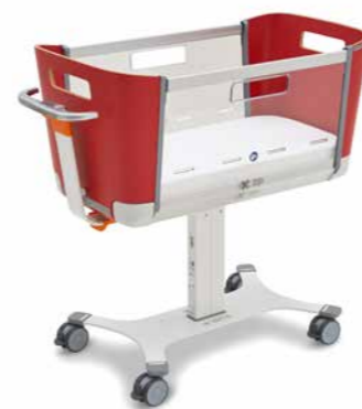
▲ Farbiges Design: Rot