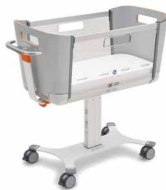
▲ Neutrales Design: Grau